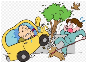
お父さんの車にキス増えてない？