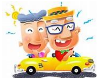
安心して乗っていただけるわ！