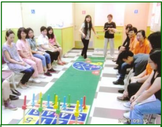
ゲ-ゴルゲーム運動療法 ビンゴ輪投げゲーム