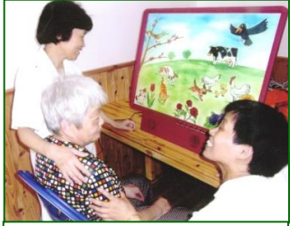
サウンドQ&A 回想療法