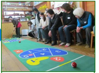
ゲ-ゴルゲーム運動療法 ゲ-ゴル・ゴルフゲーム