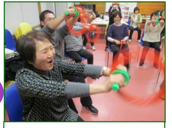
フラハント有酸素運動