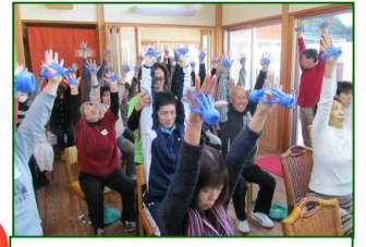
フィンガースポーツ運動療法