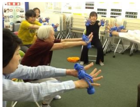
フィンガースポーツ運動