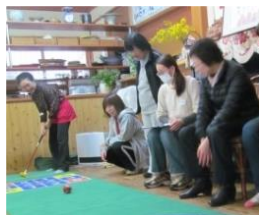
ゲ-ゴルフ-ム運動療法