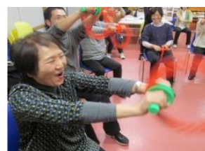
フラハンド有酸素運動