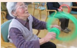
フラハンド有酸素運動

体幹と体のバランスを整えます。反射神経や集中力を向上させ、前頭前野を活性化します。